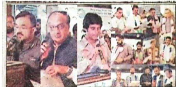
ڈیرہ غازیخان: ورکنگ کمیٹی آف ایسٹی سرور عبدالقادر خان کھوسہ، ڈپٹی کمشنر شاہد زمان لک اور ڈی پی او سید علی ڈیرہ چیمبر کے نو منتخب صدر اور ممبران سے حلف لے رہے ہیں