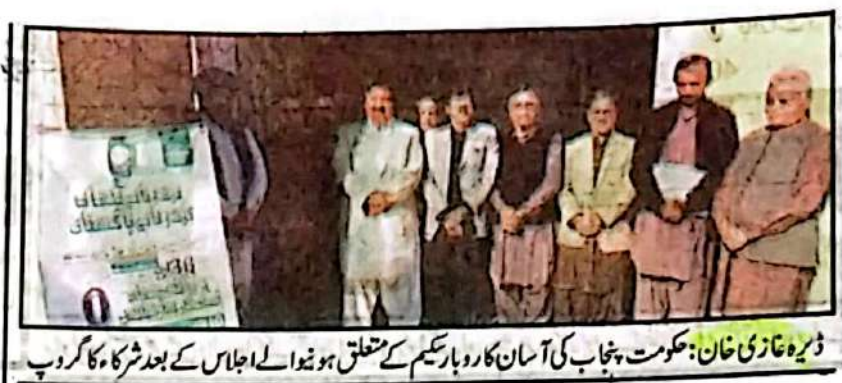
ڈیرہ غازی خان: حکومت پنجاب کی آسان کاروبار سکیم کے متعلق ہونے والے اجلاس کے بعد شرکاء کا گروپ