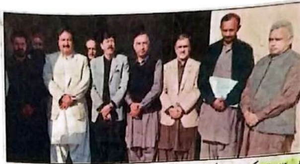
ڈیرہ قازخان، حکومت پنجاب کی آسان کاروبار اسکیم کے متعلق اجلاس کے اختتام پر صدر جمہیر آف کامرس سردار ذوالفقار علی خان کھوسہ، چیئرمین ڈائریکٹری پنجاب سال انڈسٹریز کارپوریشن عبدالہادی ہاشمی و دیگر کاروبار فوٹو