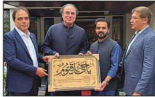
سینئر نائب صدر ڈیرہ چیئرمین مرزا ظفر اقبال وفاقی وزیر خزانہ محمد اورنگزیب کو اعزازی شیلڈ پیش کر رہے ہیں

ہم صوبوں کی مشاورت سے آگے بڑھیں گے، وفاقی وزیر خزانہ کا پری بجٹ کانفرنس سے خطاب اس موقع پر صدر فیڈریشن آف چیئرمین عرفان شیخ، سابق صوبائی وزیر ایس ایم تنویر اور دیگر موجود تھے