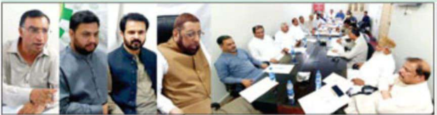
ڈیرہ: چیئرمین آف کامرس اینڈ انڈسٹری کی ایگزیکٹو کمیٹی کا اجلاس ہو رہا ہے