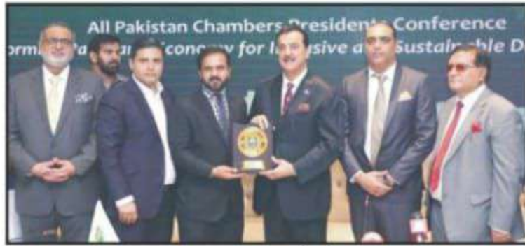
ڈیرہ غازیخان: چیئر مین سینٹ سید یوسف رضا گیلانی سینئر نائب صدر ڈیرہ جمیئر مرزا ظفر اقبال کو شیلڈ سے ہے ہیں۔