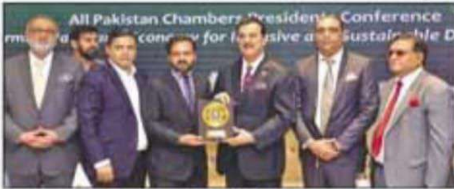
ڈیرہ: چیئرمین سینیٹ یوسف رضا گیلانی، مرزا ظفر اقبال کو شیلڈ دے رہے ہیں

پاکستان کے 11 شہسروں سے یک وقت شائع ہونے والا واحد اخبار بدھ 22 مارچ 319 | 24 جولائی 2024ء | 18 ہزار صفحات 8 قیمت 40 روپے