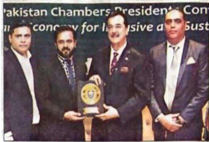
چیئر مین سینٹ سید یوسف رضا گیلانی سینئر نائب صدر ڈیرہ جمیہ مرزا ظفر اقبال کو شیلڈ دے رہے ہیں